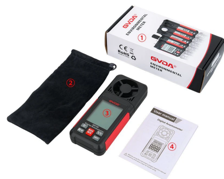
1.Gift Box 2.Bag 3.Digital Anemometer 4.Manual